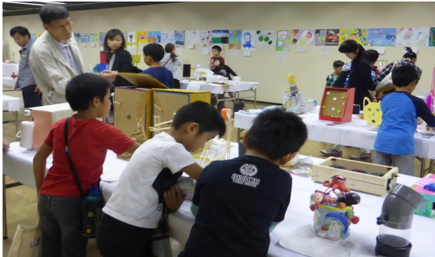
平成28年度三重県発明くふう展展示状況