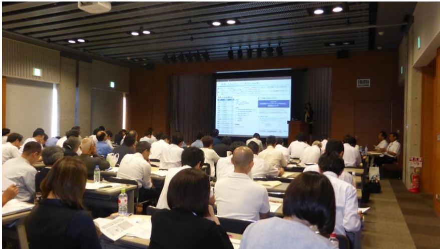
初心者向け知的財産権制度説明会（四日市商工会議所）